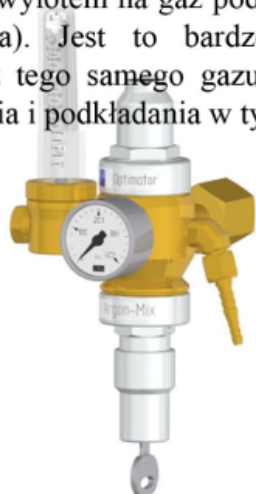
wersja z zabezpieczeniem na kluczyk

Za każdym razem, kiedy zaczynasz używać tradycyjnego reduktora duże ilości gazu ochronnego marnują się. Z Optymatorem ELGA przepływ gazu jest optymalizowany od pierwszej sekundy. Policz swoje oszczędności z Optymatorem z firmą R-Line . Przedstawiciel naszej firmy dokona elektronicznego pomiaru przepływu jak i zużycia gazu przy pomocy Państwa reduktora oraz optymatora ELGA w tym samym cyklu spawalniczym.