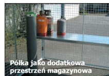
Półka jako dodatkowa przestrzeń magazynowa